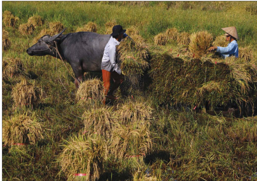
Cần tăng cường liên kết để nông nghiệp vùng ĐBSCL phát triển bền vững, hiệu quả Ảnh tư liệu

Đồng bằng sông Cửu Long (ĐBSCL) là vùng sản xuất nông nghiệp trọng điểm của cả nước, có lợi thế phát triển đa dạng các mặt hàng nông sản. Tuy nhiên, vùng lại chịu ảnh hưởng nặng nề của biến đổi khí hậu, nền sản xuất còn nhỏ lẻ, manh mún... Vì vậy, một trong những yêu cầu cấp thiết đặt ra hiện nay là phải tăng cường liên kết để nông nghiệp khu vực này phát triển bền vững, hiệu quả.