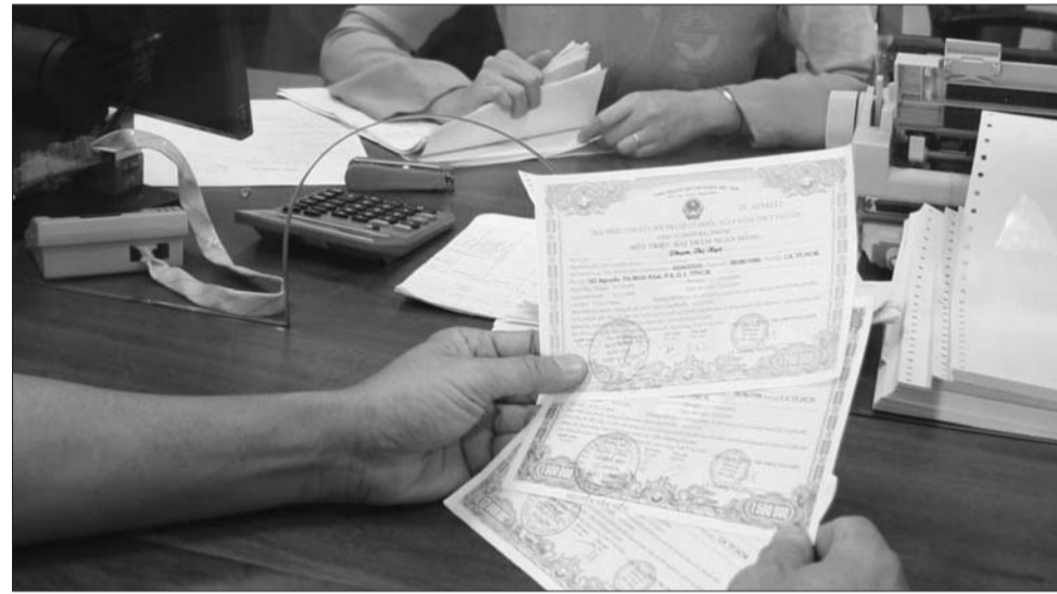
Nhà đầu tư nên "chọn mặt gửi vàng" các sản phẩm trái phiếu có mức an toàn cao hoặc rủi ro thấp

Theo dự báo, triển vọng thị trường trái phiếu doanh nghiệp (TPDN) năm nay vẫn sẽ tiếp tục sôi động, thậm chí lãi suất phát hành có thể tăng lên. Tuy nhiên, giới chuyên gia khuyến nghị, nhà đầu tư nên "chọn mặt gửi vàng" các sản phẩm trái phiếu có mức an toàn cao hoặc rủi ro thấp.