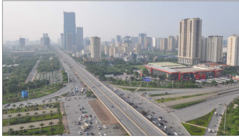
Việc thu hút hiệu quả nguồn lực của kiều bào sẽ đóng góp tích cực cho sự phát triển của quê hương, đất nước

Để hiện thực hóa khát vọng phát triển đất nước phồn vinh, Đảng và Nhà nước chủ trương phát huy cao độ nguồn lực bên trong, đồng thời đẩy mạnh huy động nguồn lực bên ngoài, tạo thành sức mạnh tổng hợp để xây dựng đất nước. Trong bối cảnh đó, việc thu hút hiệu quả nguồn lực của kiều bào sẽ tạo nên một nguồn lực quan trọng đóng góp tích cực cho sự phát triển của quê hương, đất nước.