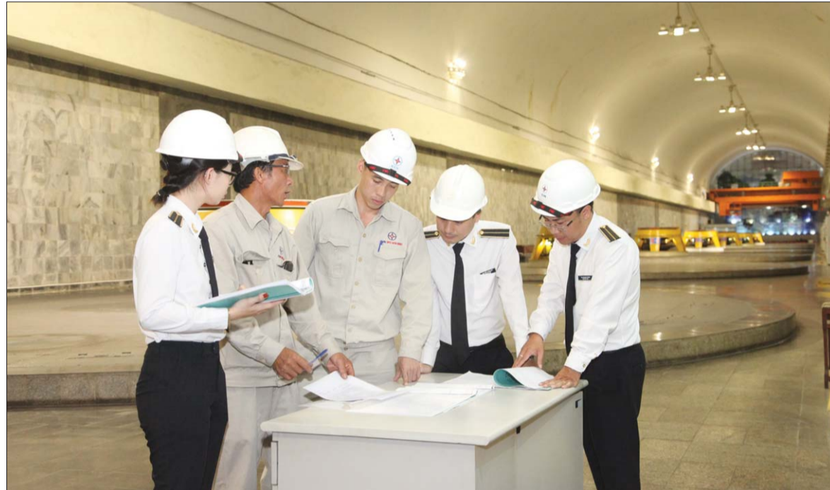
Thời gian qua, KTNN đã tổ chức triển khai nhiều cuộc KTHĐ và bước đầu đạt được những kết quả đáng chú ý Ảnh tư liệu

Xác định kiểm toán hoạt động (KTHĐ) là xu thế kiểm toán hiện đại trên thế giới, KTNN Việt Nam đang từng bước xây dựng, thực hiện những giải pháp nhằm phát triển KTHĐ, trong đó có công tác đào tạo, nâng cao năng lực của kiểm toán viên - yếu tố đóng vai trò đặc biệt quan trọng giúp nâng cao chất lượng, hiệu quả KTHĐ.