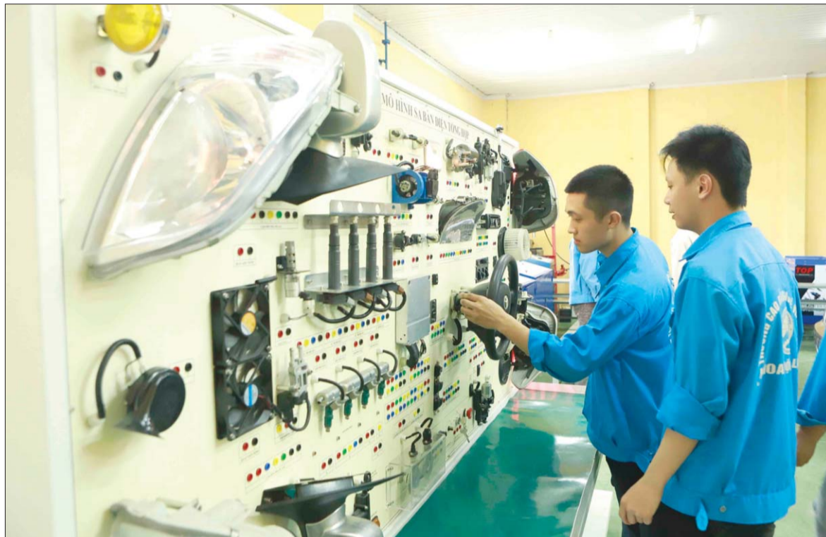
Các cơ sở giáo dục nghề nghiệp cần tăng cường thực hiện việc tổ chức đưa HS, SV đi thực tập tại DN

Việc tổ chức đưa học sinh, sinh viên (HS, SV) đi thực tập tại DN sẽ mang lại lợi ích kép, khi HS, SV được sớm làm quen với môi trường làm việc và định hướng công việc của mình một cách rõ nét ngay từ khi còn đang học. Do đó, theo các chuyên gia, đưa người học nghề đi thực tập từ sớm, đảm bảo thực chất là chủ trương đúng đắn và các cơ sở giáo dục nghề nghiệp (GDNN) cần tăng cường thực hiện hơn nữa.