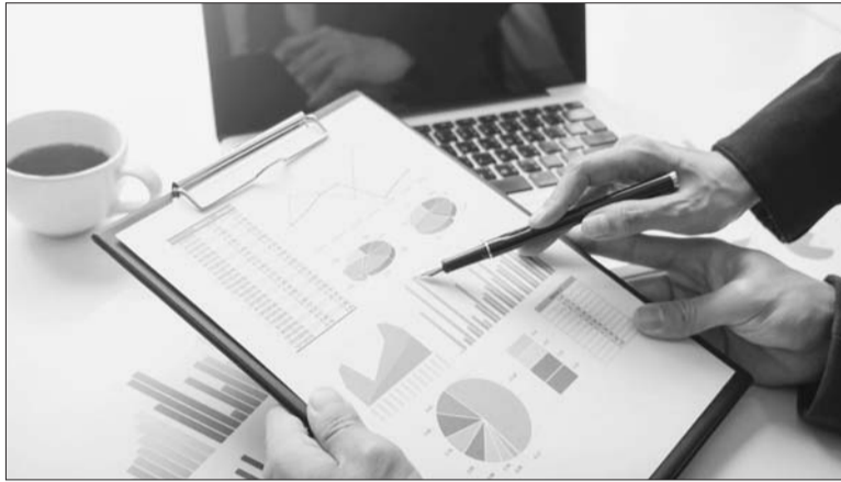
Đánh giá nhân sự là một phần không thể thiếu của chức năng kiểm toán nội bộ khi thẩm định và quản lý rủi ro của tổ chức. Ảnh minh họa

Đánh giá nhân sự đã phát triển từ một danh sách kiểm tra đơn giản về những việc nên/không nên làm hoặc các kế hoạch định kỳ thành quy trình toàn diện, bền vững, đồng thời là một phần không thể thiếu của chức năng kiểm toán nội bộ khi thẩm định và quản lý rủi ro của tổ chức.