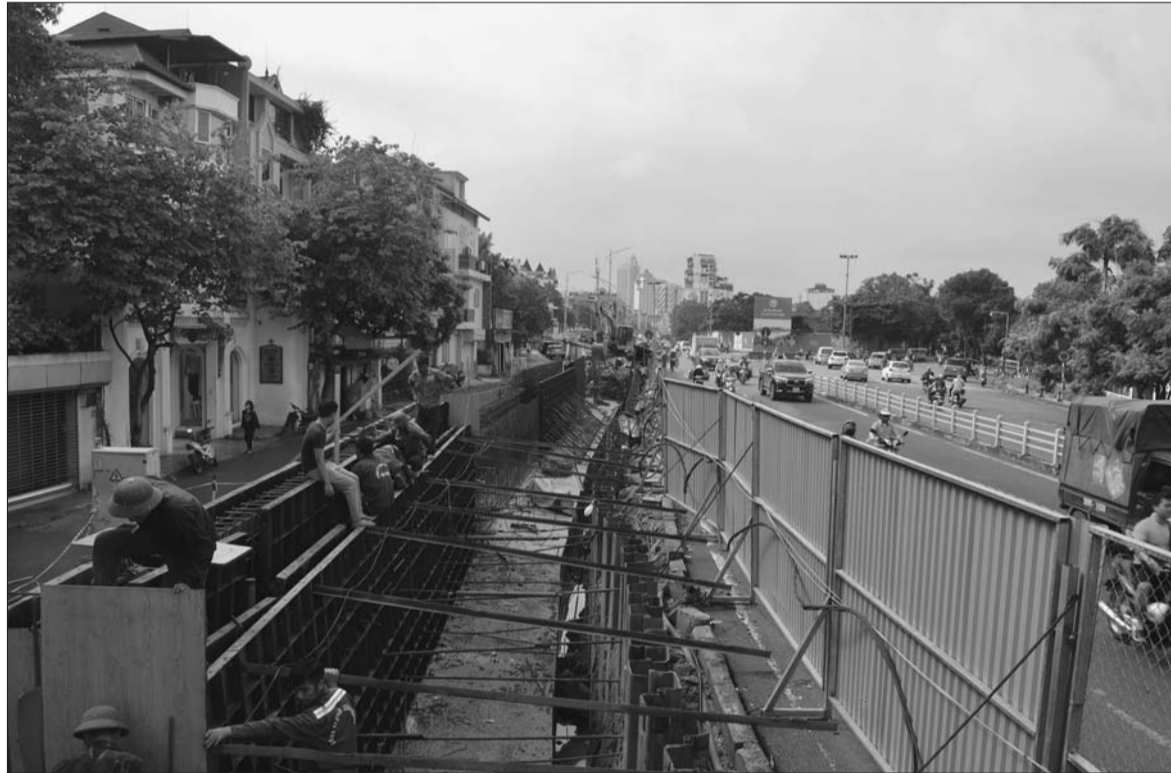
Giải ngân vốn đầu tư công đã có nhiều tín hiệu khả quan

Bộ Tài chính cho biết, 2 tháng đầu năm 2022, cả nước giải ngân được trên 44.612 tỷ đồng, đạt 8,61% kế hoạch Thủ tướng Chính phủ giao. Tỷ lệ này cao hơn so với cùng kỳ năm 2021 (5,09%). Đây là một tín hiệu khả quan cho thấy sự nỗ lực của hệ thống chính trị trong việc quyết liệt giải ngân ngay từ những ngày đầu năm.