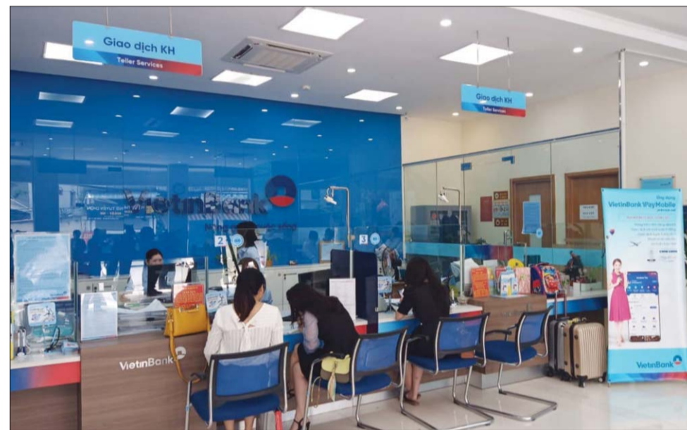
Việc điều hành chính sách tiền tệ để vừa ổn định vĩ mô, vừa hỗ trợ nền kinh tế là một thách thức không nhỏ đối với NHNN

Sau nhiều tháng sụt giảm, lãi suất huy động những tháng đầu năm có xu hướng đi lên và dự báo sẽ còn tiếp tục tăng trong thời gian tới. Khi huy động vốn tăng, ngân hàng sẽ phải tăng lãi suất cho vay để duy trì biên độ lợi nhuận. Trong khi đó, Chính phủ yêu cầu ngành ngân hàng tiếp tục giảm lãi suất cho vay năm 2022 để hỗ trợ DN. Đây sẽ là thách thức của các ngân hàng.