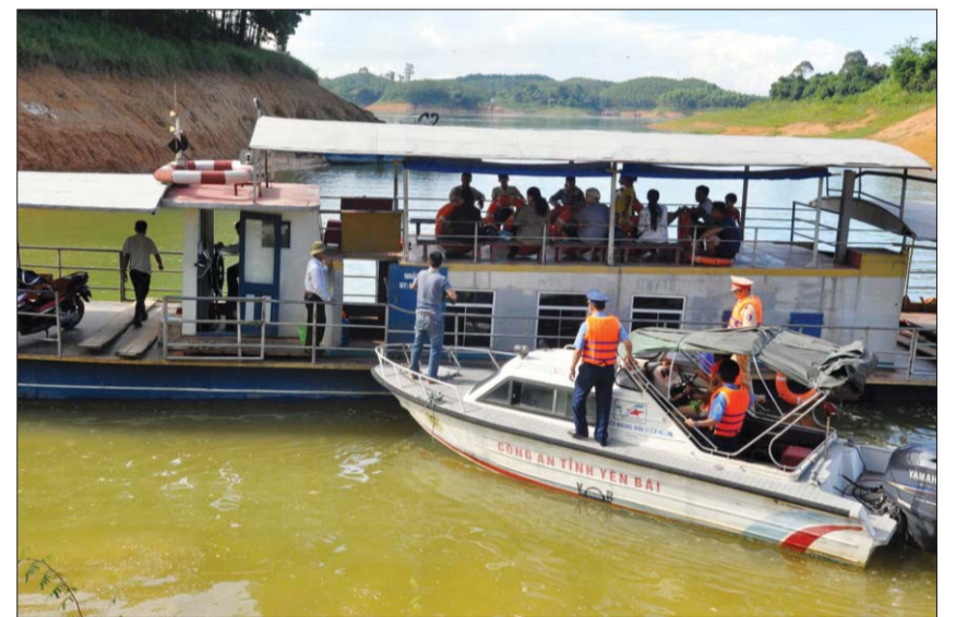
Đoàn kiểm tra liên ngành kiểm tra hoạt động vận tải hành khách tại cảng Hương Lý, huyện Yên Bình, tỉnh Yên Bái

Theo thống kê, chỉ tính riêng năm 2021, toàn quốc xảy ra 53 vụ tai nạn giao thông đường thủy, làm chết 35 người và 1 người bị thương. Tháng 01/2022 xảy ra 3 vụ làm 2 người chết; tháng 02/2022 xảy ra 4 vụ, 2 người chết (chưa tính vụ chìm ca nô ở Quảng Nam)... Có thể nói, số lượng vụ tai nạn giao thông đường thủy thường xảy ra ít hơn so với giao thông đường bộ, tuy nhiên tai nạn giao thông đường thủy nguy hiểm hơn đường bộ. Khi xảy ra tai nạn đường thủy thường gây hậu quả