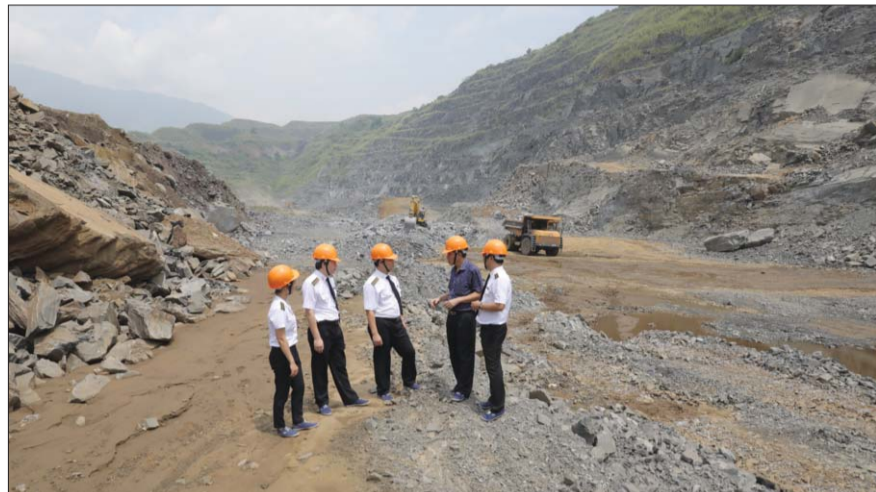
Kiểm toán viên nhà nước làm việc tại thực địa

Cuộc kiểm toán cũng nhằm phát hiện các hành vi sai phạm trong công tác QLNN về đất đai để kiến nghị xử lý theo quy định. Đồng thời, đánh giá tính hiệu lực, hiệu quả của công tác QLNN về đất đai tại các cơ quan QLNN có liên quan tại địa phương.