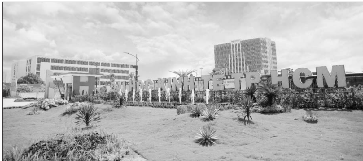
KTNN đã phát hiện nhiều bất cập cần chấn chỉnh trong công tác quản lý, sử dụng tài chính công, tài sản công năm 2019 tại Trường Đại học Kinh tế TP. HCM