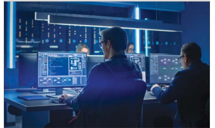
An ninh mạng có thể mang đến nhiều rủi ro cho DN

Ngoài 2 yếu tố trên, các chuyên gia trên toàn cầu cho rằng, các vấn đề về môi trường, xã hội, quản trị (ESG) và báo cáo về những vấn đề này sẽ trở nên quan trọng hơn trong năm 2022, đồng nghĩa với việc đây có thể sẽ là những lĩnh vực ẩn