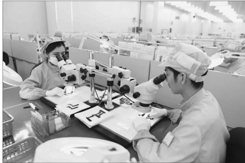
Sản xuất linh kiện điện tử tại Công ty Điện tử YPE Vina, Vĩnh Phúc

Ngay từ những tháng đầu năm 2022, cộng đồng DN đã có những tín hiệu phục hồi rõ nét hơn khi lượng DN thành lập mới và quay trở lại hoạt động tăng cao. Tuy nhiên, các DN vẫn rất cần một môi trường đầu tư, kinh doanh thông thoáng hơn, minh bạch hơn, nhất là giảm thiểu mọi chi phí, giúp DN có thêm nguồn lực để phục hồi một cách mạnh mẽ.